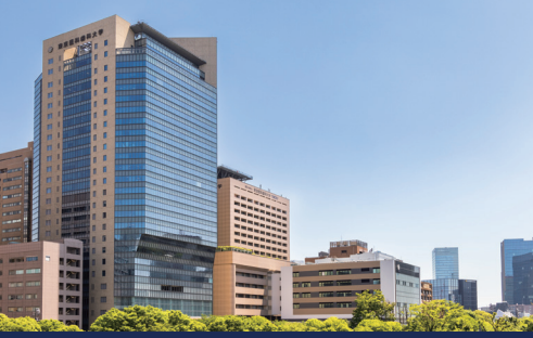
東京医科歯科大学